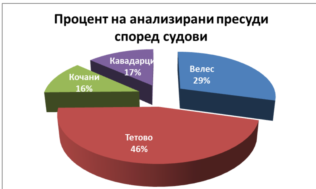
Графикон 2: Процент на пресуди според судот што ги донел

Со цел да се добие претстава за дистрибуцијата на пресудите според основните судови кои беа предмет на анализа, на Графикон 2 подолу, претставено е вкупното процентуално учество на пресудите според основниот суд каде што тие биле донесени, без оглед на периодот во којшто биле донесени.